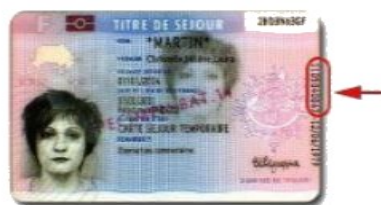
Sur le titre de séjour électronique délivré depuis le 23 juin 2011, il est ICI