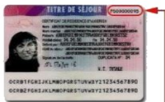
Sur le titre de séjour délivré de 2002 à 2011, il est ICI (sans la lettre)