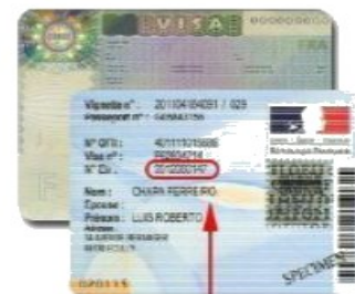
Pour les détenteurs de visa long séjour valant titre de séjour (VLS-TS) il se trouve sur la vignette OFII - ICI